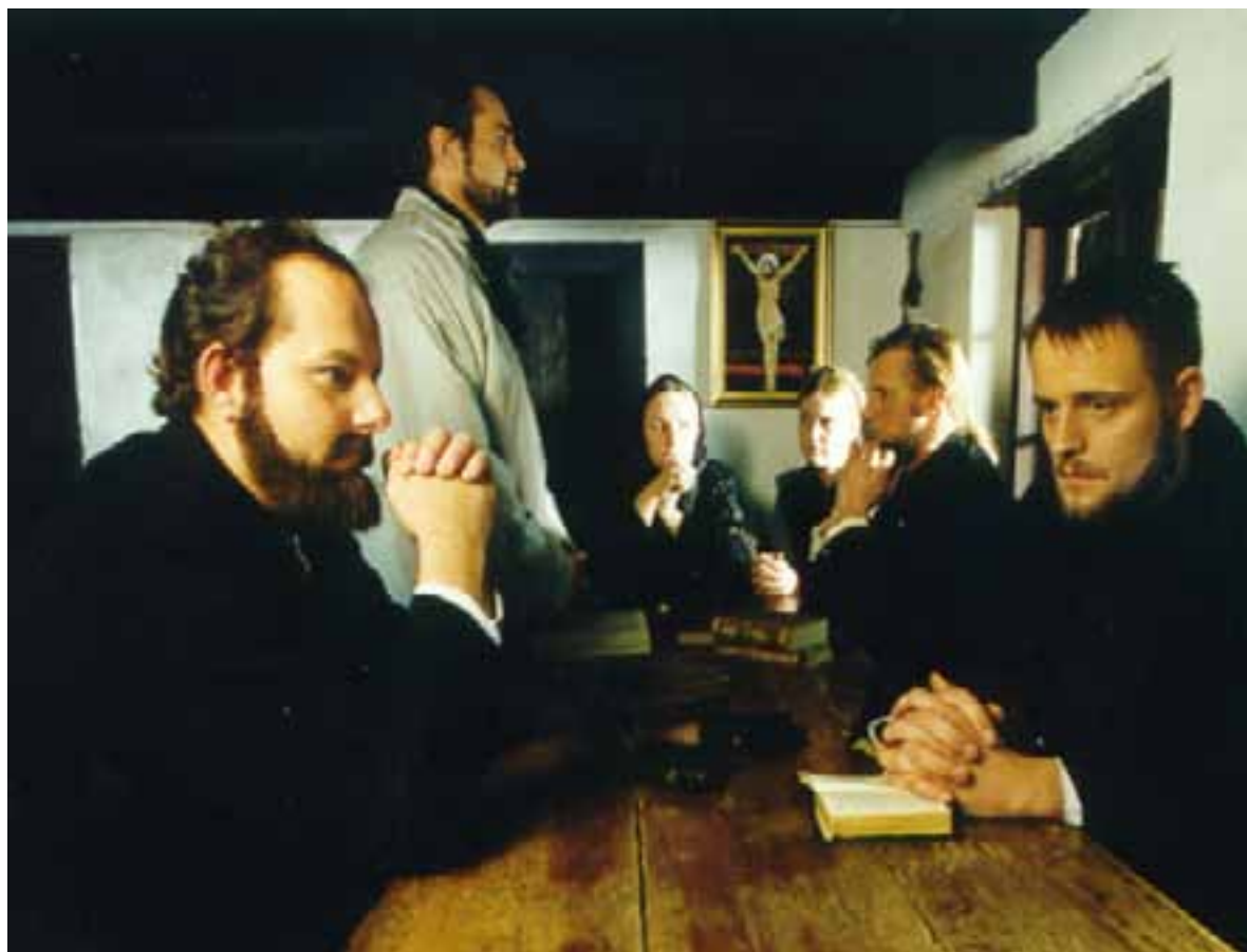
Guds Børn anno 1998