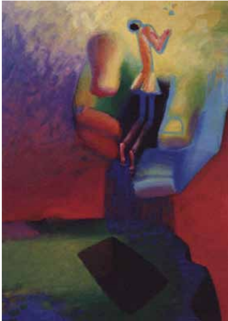
Opstandelse, Arne Haugen Sørensen, 1995-96

På billedet ses et par store hænder, der hæver en lille menneskefigur op fra en mørk firkant (grav) og ind i lyset. Over menneskefiguren svæver et fuglelignende væsen – måske en due? Menneskefigurens ansigt og hænder søger lyset og fødderne giver ligesom afsæt, som om figuren springer op i de store hænder. Billedet kan fortolkes sådan, at det er Guds hænder, der trækker et menneske (Kristus?) op af graven. Duen forbinder dåb og opstandelse; det er i dåben, at mennesket får løftet om opstandelsen.