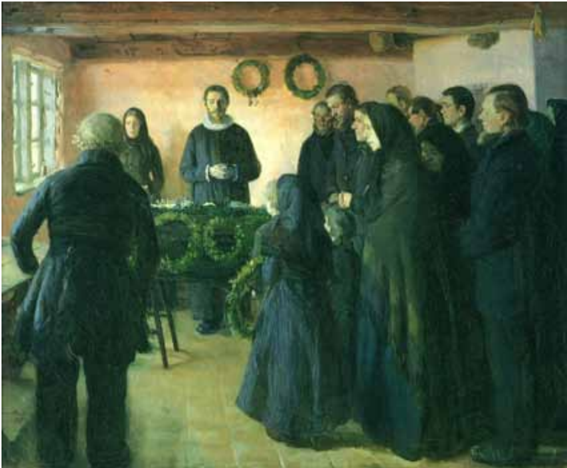
En begravelse, Anna Ancher, 1891