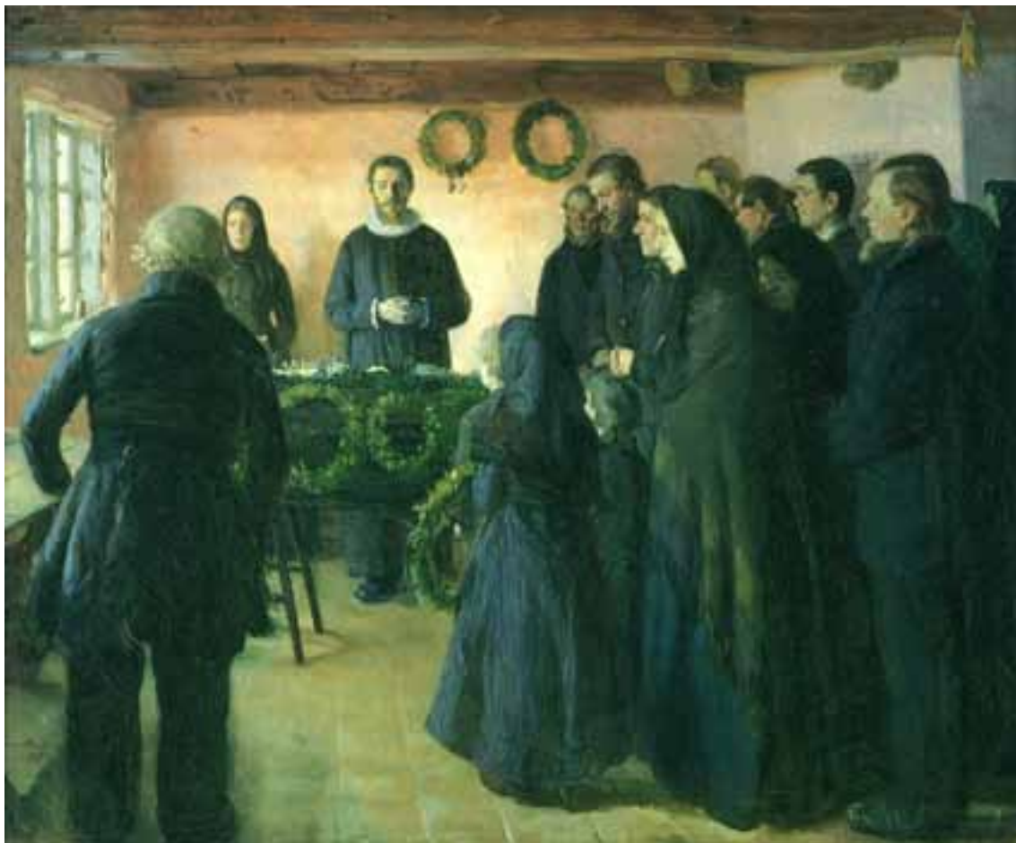
En begravelse, Anna Ancher, 1891