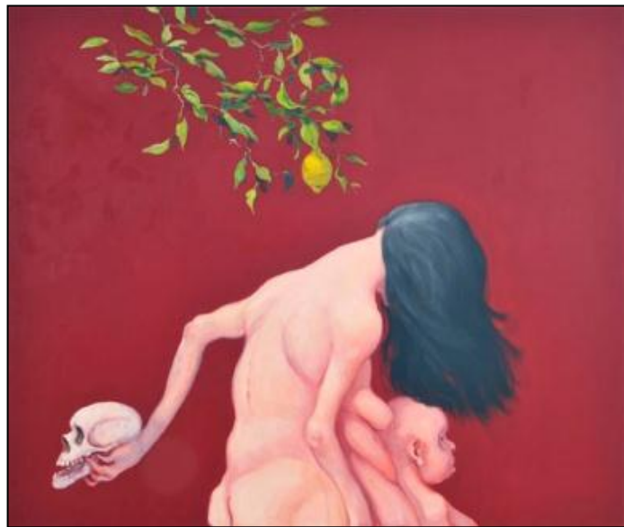
Michael Kvium, Bitter Fruit

I maleriet Bitter Fruit er titlen, citronen og kraniet symboler, der kan lukke billedets betydning op. 'Den bitre frugt' og 'døden i baghånden' giver måske mening sammen med det bøjede hoved, når man læser den bibelske beretning om syndefaldet.