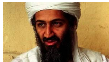
Anders Breivik Osama bin Laden