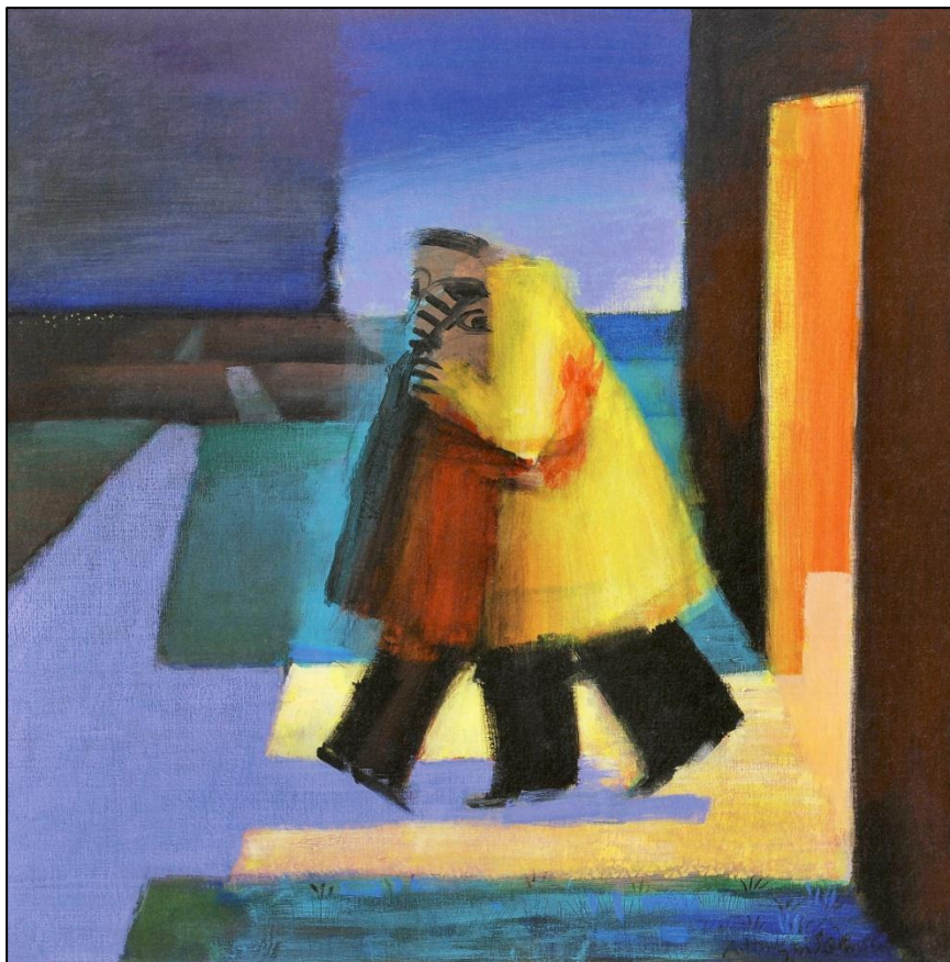
Arne Haugen Sørensen: Hjemkomsten , 1999.