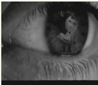
Medina: Det er synd for dig.

Ordet betyder lyst eller nydelse. Meningen med livet er nydelse, og mennesket har en række behov og lyster, som det gælder om at få opfyldt. Lykkes det, bliver livet godt. Det gælder om at undgå alt de, man ikke har lyst til – og som medfører lidelse.