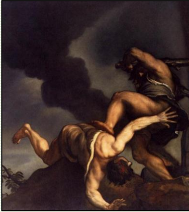
Tizian, Kain & Abel