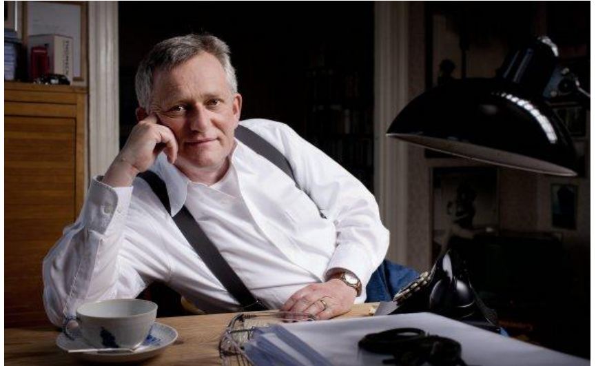
Søren Ulrik Thomsen. Dansk forfatter og digter