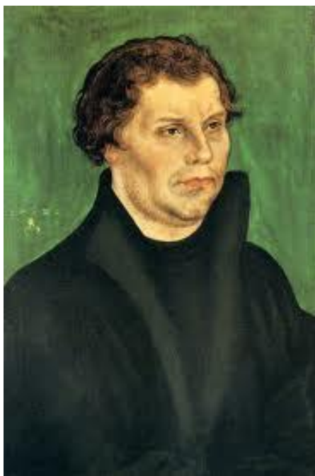
Portræt af Martin Luther

uden for klostrene, fordi de ikke skulle igennem de mange farlige barnefødsler. Indtil Reformationen fandt sted, var klostrene ofte de eneste steder, hvor kvinder fik undervisning. For eksempel kunne nonner læse og skrive, hvilket mange kvinder selv blandt adelen aldrig lærte. Dertil kommer, at mange kvinder ikke, som mændene, havde noget alternativ til klostrene. En munk, der forlod et kloster, kunne blive håndværker, lærer eller måske endda præst. En nonne kunne derimod kun gifte sig.