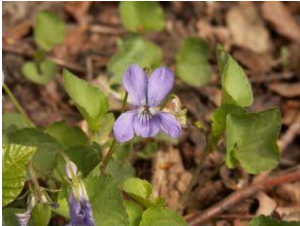
Skovviol blomstrer i marts og april.