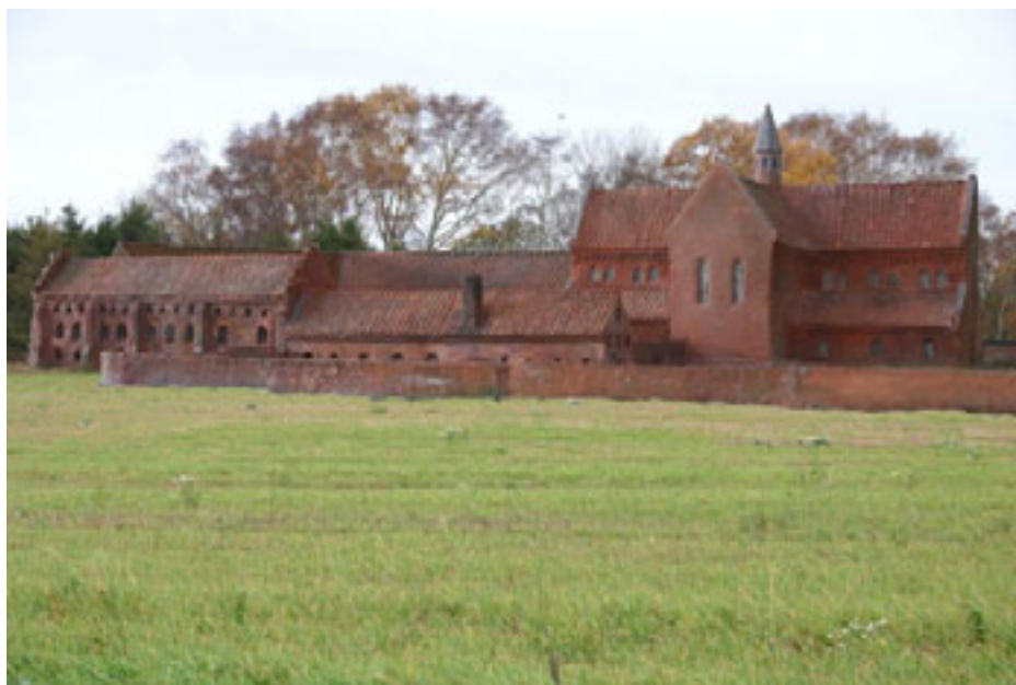
Model af Esrum Kloster

Skandinaviens mest betydningsfulde cistercienserkloster blev grundlagt af ærkebiskop Eskil i samarbejde med Bernhard af Clairvaux. Klosteret kom til at ligge i det forladte Esrum Kloster, der oprindeligt blev bygget som benediktinerkloster. Esrum Kloster blev indviet som cistercienserkloster i år 1151.