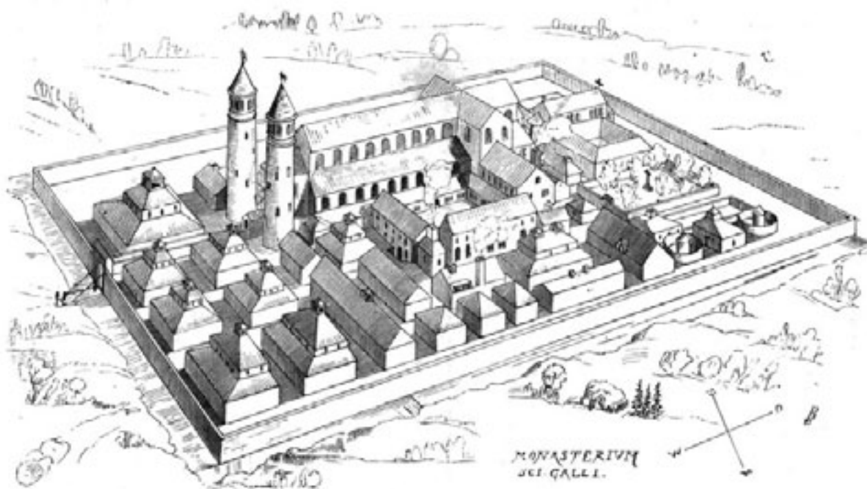
* Kloster Sanct Gallen nach dem Grundrisse vom Jahre 830. (Lasius).

Ud fra klosterplanen på forrige side kan man få en fornemmelse af alle de funktioner, som et kloster havde. Her kan man se angivelse af et sygehus, en have med lægeplanter, bolig for lægen, necessaries (toiletter), badehus, køkken, spisesal, sovesal og kirken. De fleste klosteranlæg har også omfattet gæstehus for fornemme gæster og et fattigherberg.