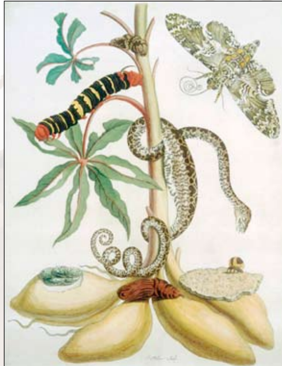
Ill. af Maria Sibylla Meriam

Med afsæt i den tysk-hollandske forsker og kunstner Maria Sibylla Merians fantastiske malerier af forvandlinger i naturen gives en indføring sommerfuglens udvikling fra æg over larve og især puppe – til den flyvende sommerfugl. Denne forvandling paralleliseres til hovedtrækkene i Jesu liv fra fødsel over korsfæstelse og død og opstandelse.