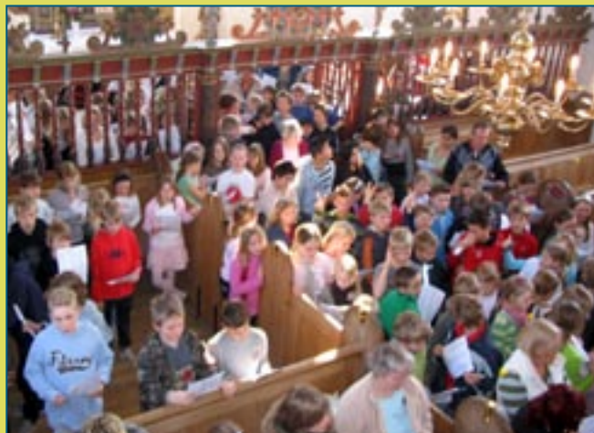
Salmesangsafslutning i Slangerup kirke 2007.